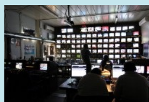
DES VIDÉOSURVEILLANTS UN PEU SCHIZOS

Au jeu des alliances PS-Verts, la vidéosurveillance est dans le domaine de la sécurité ce que le nucléaire est dans le domaine des énergies : un sujet de clash où les étiquettes politiques reprennent des couleurs. En août, Jean-Vincent Placé, sénateur EELV, avait posé une question au ministre de l'Intérieur "sur l'investissement dans la vidéosurveillance et son efficacité" , reprenant les chiffres qu'Owni avait calculés :