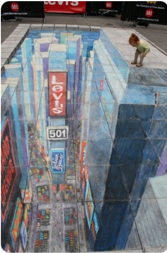
4. UNE PETITE SOIF ?