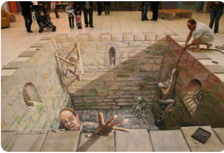
6. SOUS LES PAVÉS, LA PLAGE