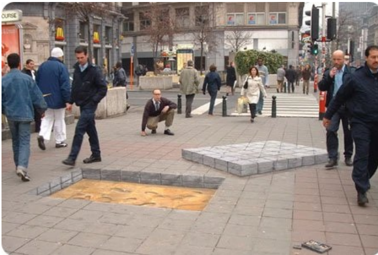
7. MÉTHODE SIMPLE POUR LAVER LA RUE