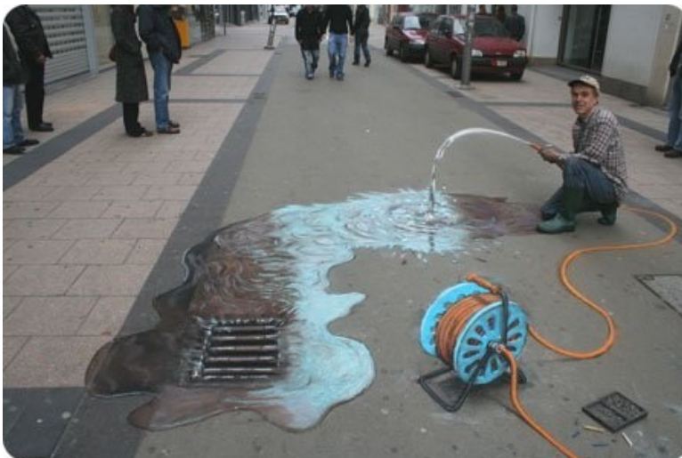
8. MONDES PARALLÈLES