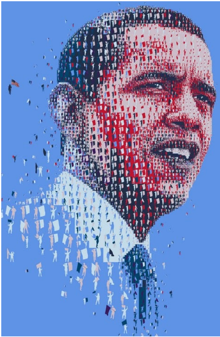
(cc) Tsevis Pixel du jour : #5d90e2