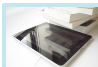
APPLE À LIVRE OUVERT

Quelques mois plus tard, en décembre, la Commission européenne essayait également d'observer si manigances il y avait eu entre des éditeurs et Apple au niveau européen.