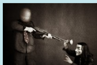
LES RAPPORTS DE LA DCRI SUR ANONYMOUS

Les deux Anonymous sont également accusés d'avoir profité d'autres failles de sécurité pour accéder aux interfaces d'administration de deux sites du gouvernement français, immigration.gouv.fr et modernisation.gouv.fr, dont la page d'accueil avait été modifiée, fin janvier, pour relayer ce message à l'État français :