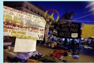
LES PROPOSITIONS DE ¡DEMOCRACIA REAL YA!