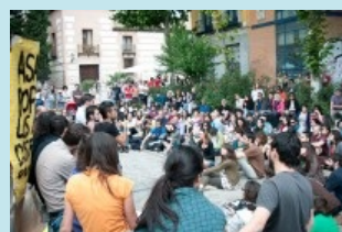
MADRID: FONCTIONNEMENT D’UNE ASSEMBLÉE DE QUARTIER

Toutes les grandes idéologies et mouvements de l’Histoire seraient ainsi parties de l’utopie : le libéralisme, le communisme, le socialisme