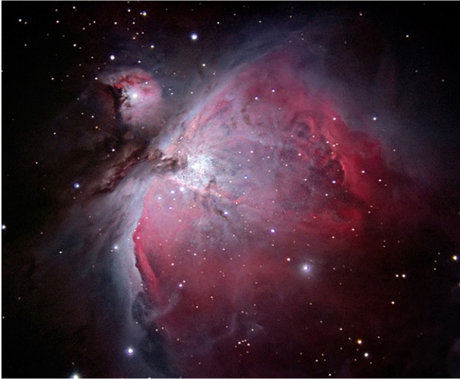
La grande nébuleuse d'Orion (M42), par Thomas Shahan. Flickr, licence CC.

près cette idée à propos d'une discipline, l'astronomie, où d'ailleurs nous rencontrerons à nouveau la photographie.