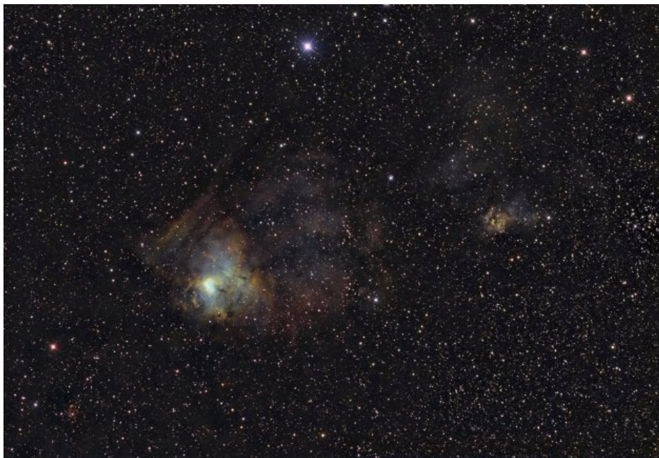
Nébuleuse planétaire OU1 découverte par l'astronome amateur Nicolas Outters.