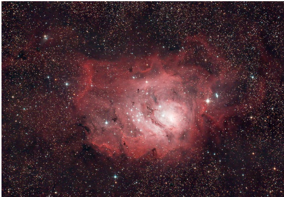
La nébuleuse du Lagon (M8), par Fred Locklear. Flickr, licence CC.