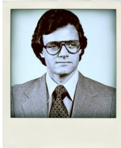
- Futuriste Multimédias