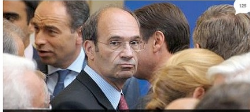
Le ministre du travail Eric Woerth, le 7 juillet 2010 à Paris.