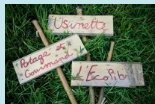
REBOOTER LES VILLAGES