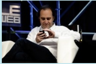
FREE MOBILE CRIE AU COMPLOT