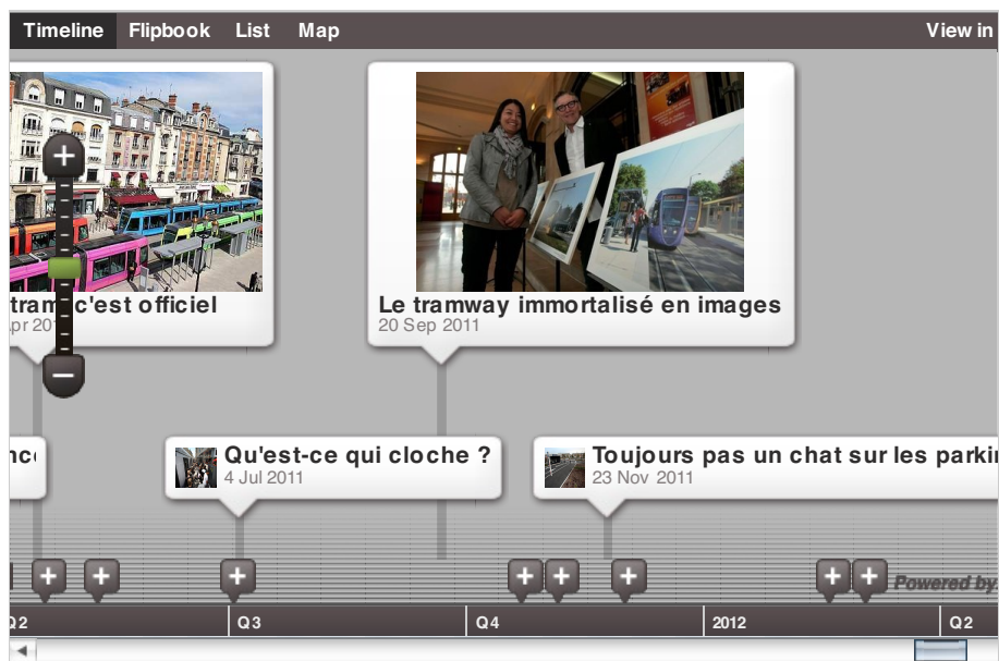
Tramway: la trame l'histoire on Dipity.

Nous n'avons pas (encore) exploité l'aspect contributif de Dipity, mais ce n'est que partie remise puisqu'il ouvre les portes du crowdsourcing .