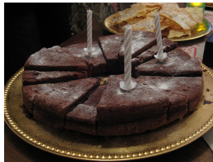
Se servir une part de gâteau

C'est donc bien un changement de paradigme: d'un côté, en quantité limitée et contrôlée derrière une barrière propriétaire, de l'autre côté : libre et autogéré. En libérant chaque domaine il faut donc bien s'assurer que la responsabilité et la conscience des utilisateurs soient prêtes pour ne pas répéter les modèles basés sur la rareté et surtout, pour savoir gérer l'abondance avec succès!