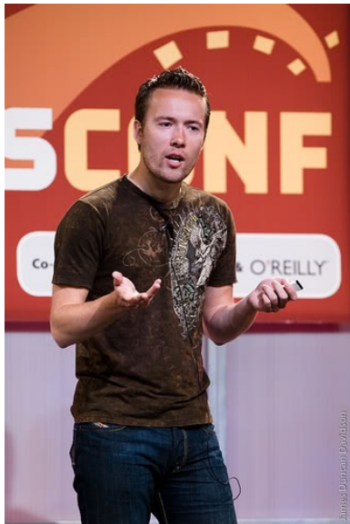
David Heinemeier Hansson fait partie de ses geeks qui