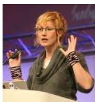
Sociologue des médias sociaux et pure geek capable de hacker son Mac

OS X. danah boyd (qui insiste pour que son noms et prénom soient orthographiés en minuscule) est une spécialiste de la relation des ados avec le monde connecté. Il s'agit aussi d'une experte et d'une actrice majeure de la culture électronique du XXI e . Je cherche encore quelqu'un chez nous citant à la fois Lawrence Lessig ou Cory Doctorow et Erwing Goffman ou Hannah Arendt.